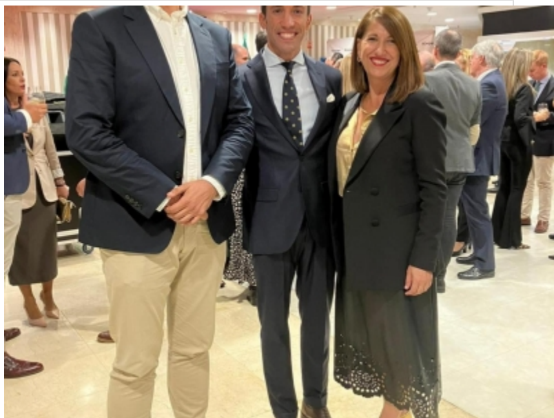
( http://www.trigueros.es/es/.galleries/imagenes-noticias/Noticias-2023/Trigueros-se-adhiere-a-la-REMTA-3.jpeg )