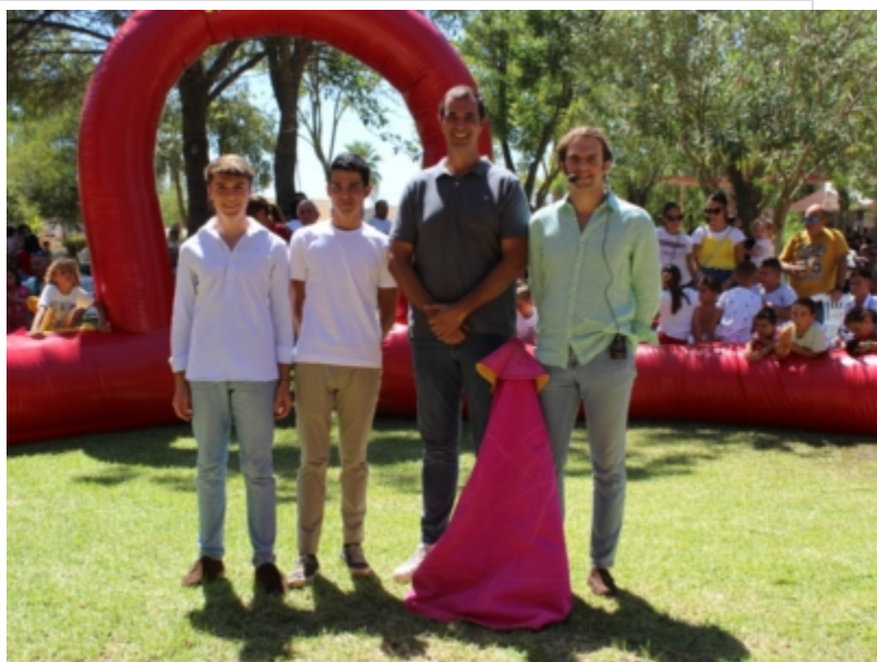
( http://www.trigueros.es/es/.galleries/imagenes-noticias/Noticias-2023/Trigueros-se-adhiere-a-la-REMTA-4.jpeg )