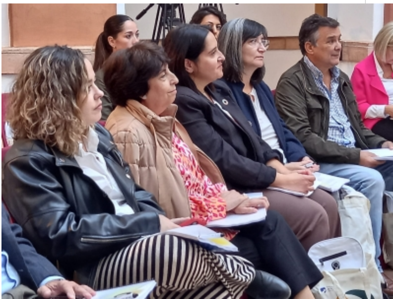
( http://www.trigueros.es/es/.galleries/imagenes-noticias/Noticias-2022/JORNADA-DE-CLAUSURA-PROYECTO-VALUETUR_NIEBLA-NOV-22-7 . )