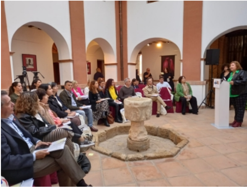
( http://www.trigueros.es/es/.galleries/imagenes-noticias/Noticias-2022/JORNADA-DE-CLAUSURA-PROYECTO-VALUETUR_NIEBLA-NOV-22-6 . )