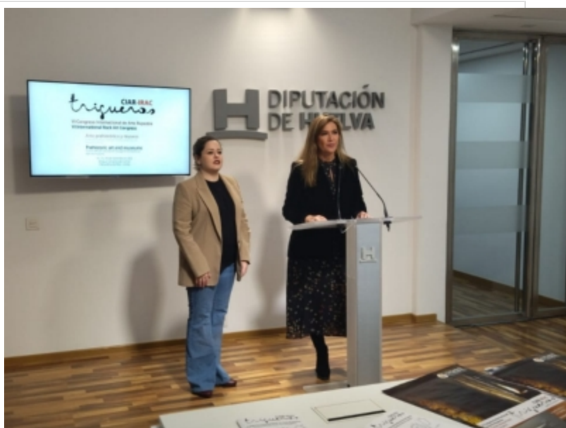
( http://www.trigueros.es/es/.galleries/imagenes-noticias/Noticias-2022/VI-CIAR_2022_Presentacion-Huelva-2.jpeg )