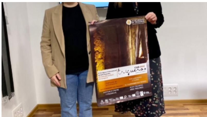
( http://www.trigueros.es/es/.galleries/imagenes-noticias/Noticias-2022/VI-CIAR_2022_Presentacion-Huelva-4.jpeg )