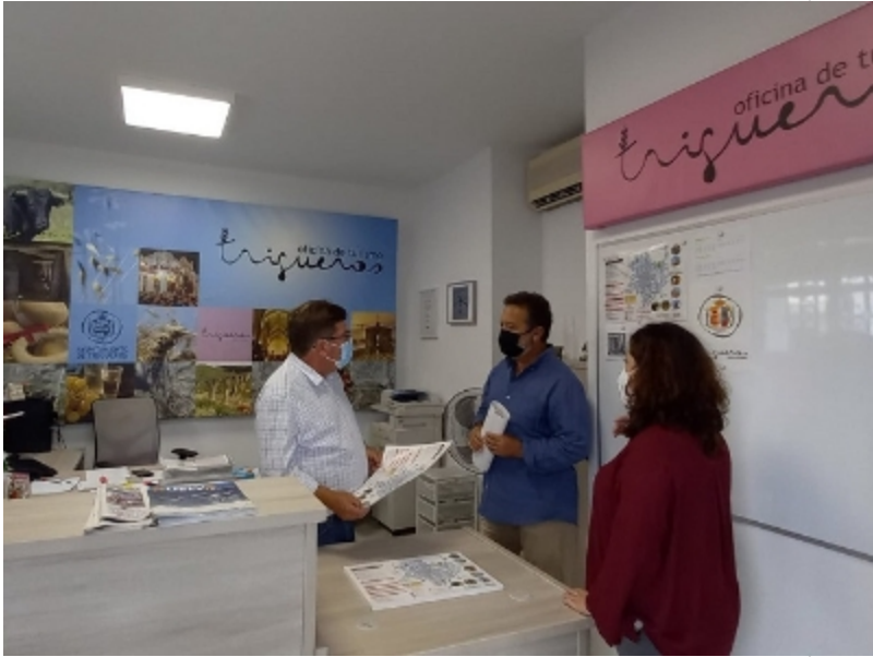
( http://www.trigueros.es/es/.galleries/imagenes-noticias/noticias-2021/INAUGURACION-OFICINA-DE-TURISMO-7.jpeg )