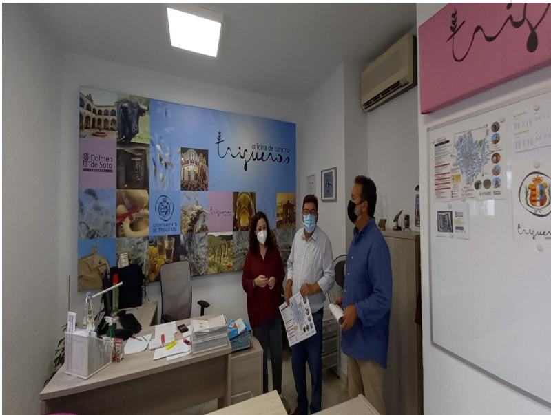
( http://www.trigueros.es/export/sites/trigueros/es/.galleries/imagenes-noticias/noticias-2021/INAUGURACION-OFICINA-DE-TURISMO-8.jpg )