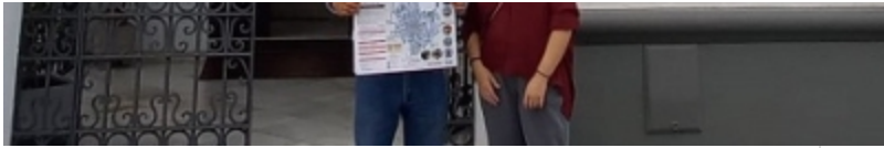
( http://www.trigueros.es/es/.galleries/imagenes-noticias/noticias-2021/INAUGURACION-OFICINA-DE-TURISMO-3.jpeg )